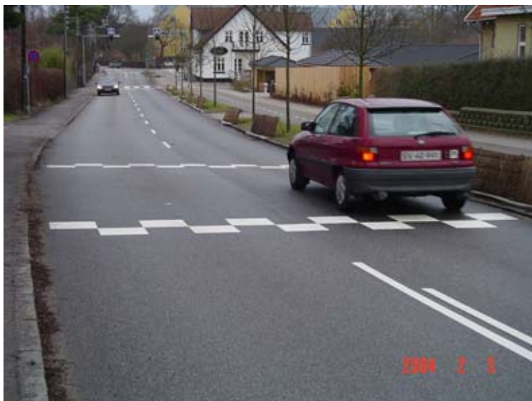
Figur 4.1: Cirkelbump i Jonstrup by i Værløse Kommune.

Tavle A36, der forvarsler et bump på vejen, bruges hvor E51 eller E53 ikke anvendes. Det vil sige inden for hastighedszone afmærket med E68-4, tættere bebygget område afmærket med E55 og lokal hastighedsbegrænsning afmærket med C55.