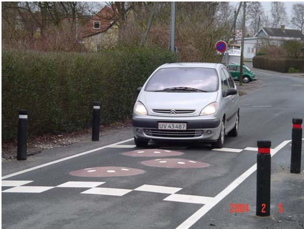
Figur 5.1: Pukkelbump i Skuldelev

Der er i de senere år udført forsøg med etablering af pukkelbump (mushrooms) i flere danske kommuner. Ideen med pukkelbump er at de skal virke på personbilerne uden samtidigt at genere buschaufførerne. Det gøres ved at placere puklerne i et mønster på tværs af vejen, så store køjetøjer pga. sporvidden kan passere bumpene med et hjulpar på hver side af puklen uden at køre op over dem, mens personbilerne har mindst et hjulpar oppe på puklen.