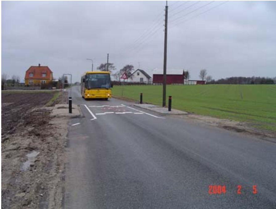
Figur 4.2: Pukkelbump ved indkørsel til Skuldelev.