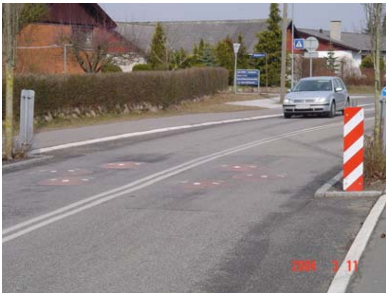
Figur 5.2: Pukkelbump på Gavnøvej i Næstved

På baggrund af erfaringerne fra Vildsted har LMK VEJ A/S udviklet et nyt mønster for placering af paddehattene i et pukkelbump med henblik på at løse problemet med den farlige tværkørsel, som en del personbiler forsøgte sig med for at undgå ubehaget ved passagen. Det nye design er udviklet til en 7 m bred vej. Der laves 75 cm indsnævring i begge sider og de resterende 550 cm er opdelt i to kørebaner adskilt af en dobbeltoptrukken linie. I hver af de to kørebaner placeres tre paddehatte. Det nye design er afprøvet på Gavnøvej i Næstved og er evalueret ved en besigtigelse i januar 2002. (ref. 56.). Herudover er der optaget video af trafikanternes passage. Ud fra observationerne ser det ud til, at trafikanterne placerer sig lidt forskelligt i tværsnittet under passage, men kun meget få overskrider den dobbeltoptrukne midtlinie. Der er ikke observeret tværkørsel hen over paddehattene.