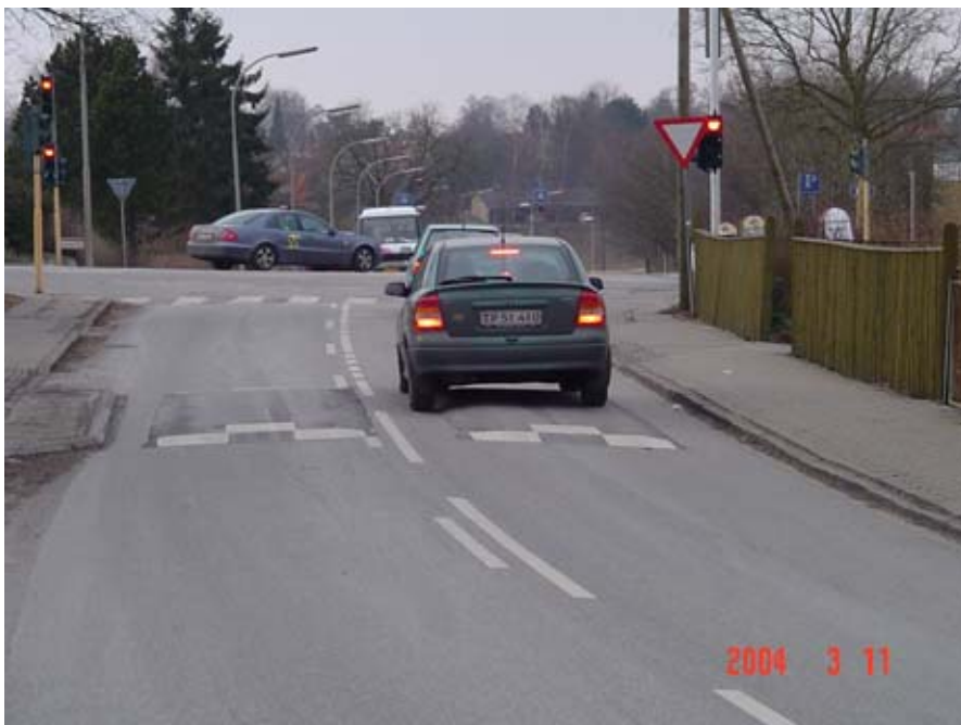
Figur 4.3: Pudebump i Birkerød.