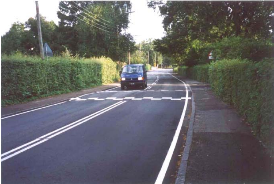
Figur 1.1: Vejbumpe er den hyppigst anvendte fysiske hastighedsdæmper.

Det er ikke alle vejbumpe, der er udført i overensstemmelse med anbefalingerne, og det giver anledning til problemer for bl.a. buschauffører.