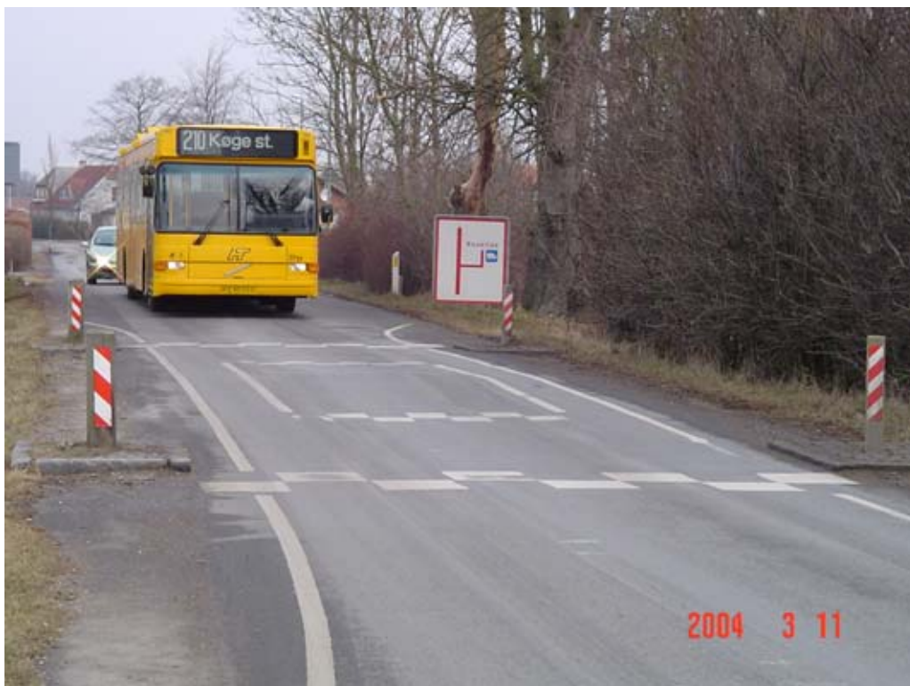
Figur 5.3: Kombinationsbump i Havdrup

Vejdirektoratet gennemførte i 1990 hastighedsmålinger på 4 vejstrækninger med kombi-bump i de 3 danske byer: Glostrup, Aalborg og Esbjerg (ref. 30).